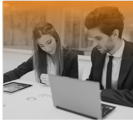
Firmas de Auditoría