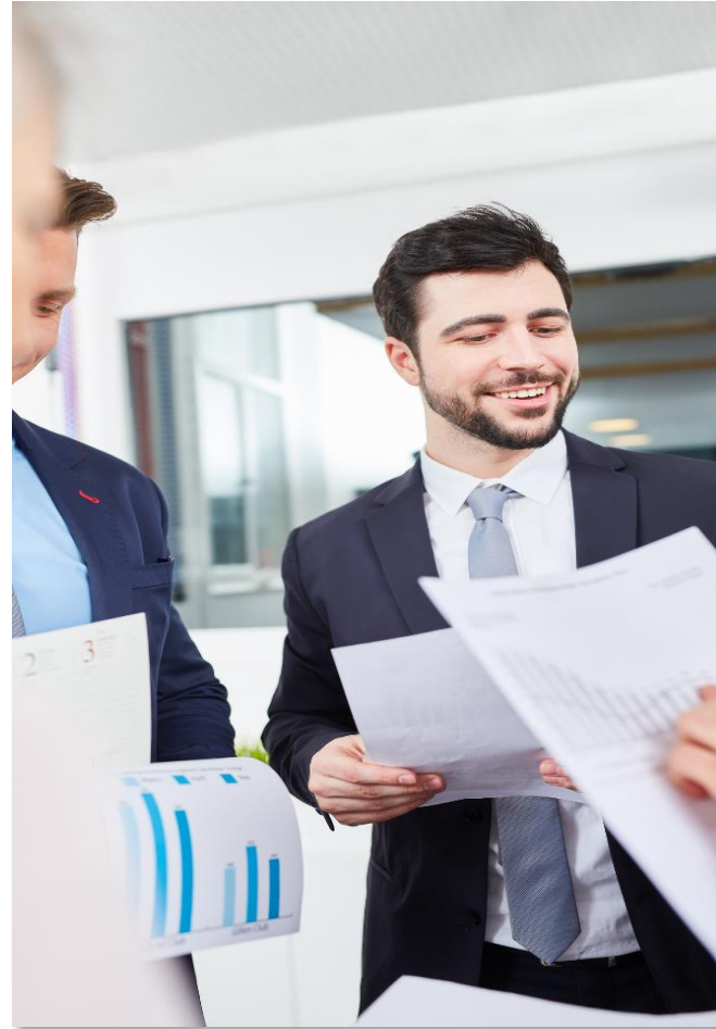
FIRMAS DE AUDITORÍA