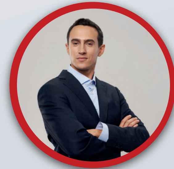
Firmas de auditoría