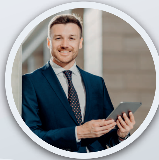
Departamentos de auditoría interna