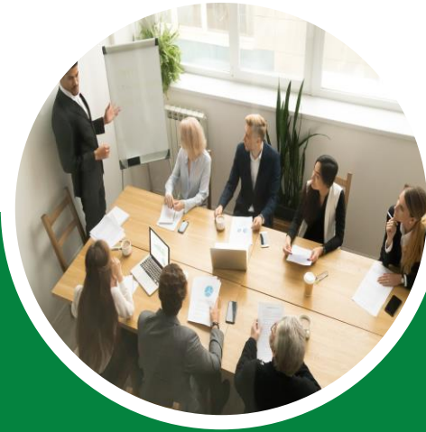
FIRMAS DE AUDITORÍA